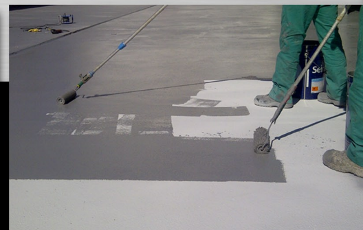
Probitano R Alifático Revestimiento de poliuretano