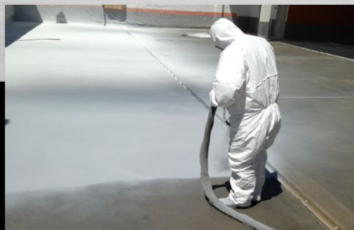
Ardex Elastorapid VK260 Poliurea impermeabilizante